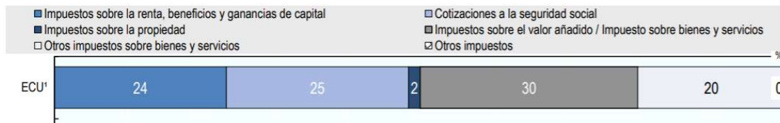
OECD (2020). Estadísticas tributarias en ALC, 2018.

El impuesto que más pagamos es el IVA. Y lo pagamos todos, ricos y pobres.